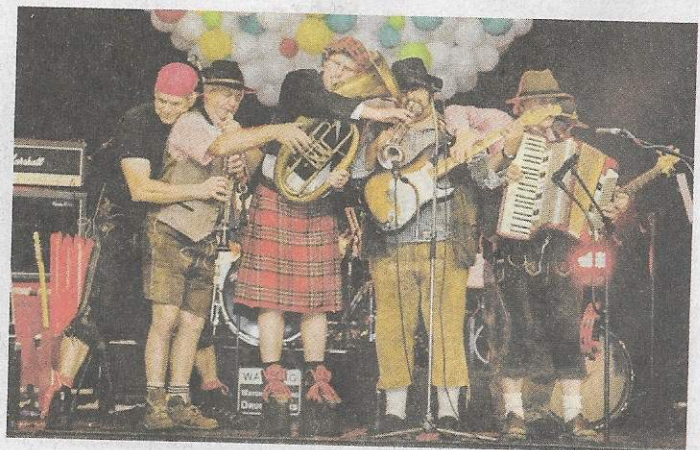
Die Klinikclowns in Aktion