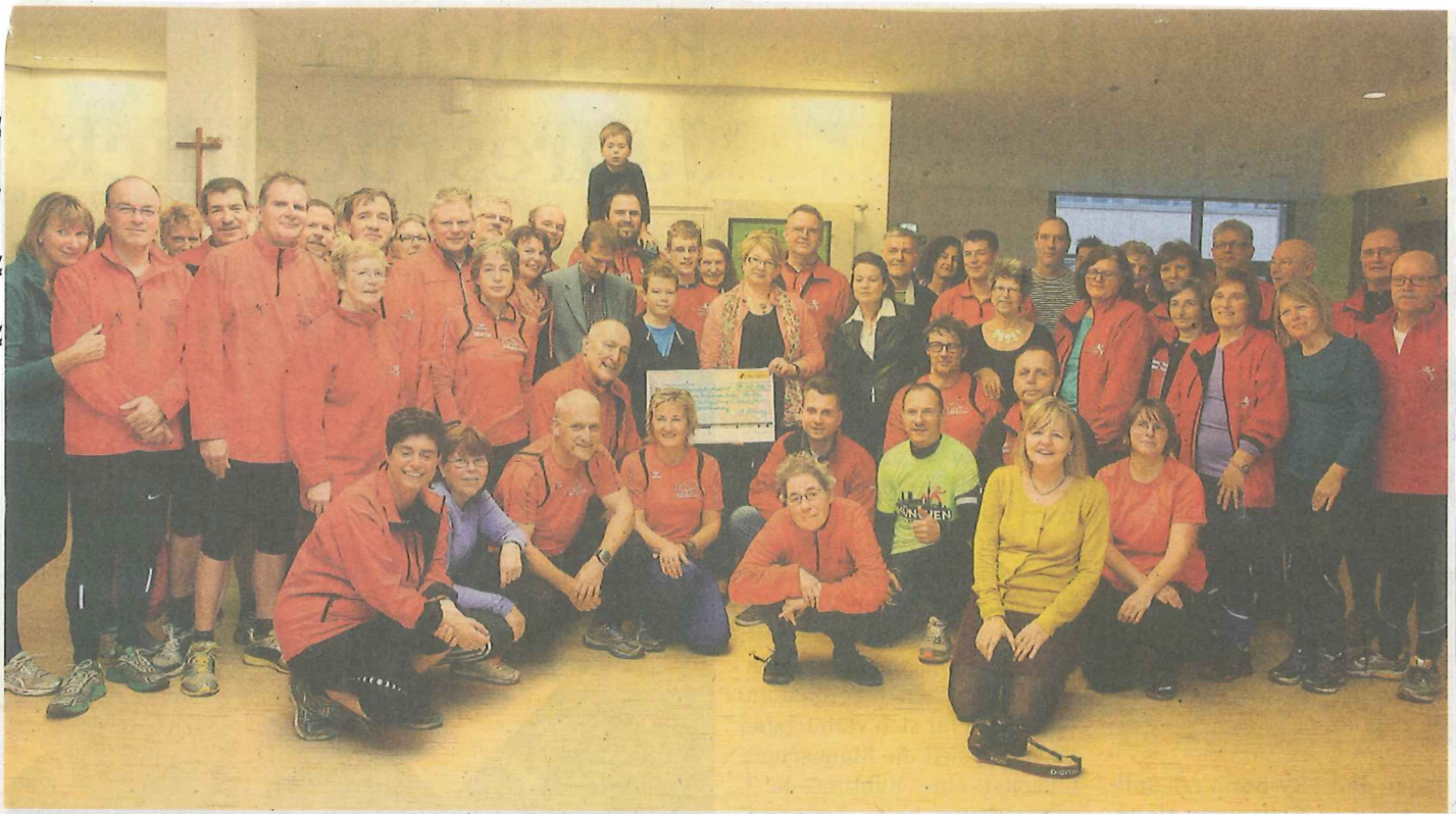
■ Ein starkes Team: Der Lauf- und Walkingtreff des TuS Mondorf unterstützt auch in diesem Jahr die Elterninitiative krebskranker Kinder mit einer großen Spende.